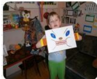
«Коробочка - порви меня»

Дети иногда проявляют агрессивность лишь потому, что не знают других способов выражения чувств. Задача специалистов — научить детей выходить из конфликтных ситуаций приемлемыми способами. Для работы с такими детьми у нас в арсенале резиновые игрушки и каучуковые шарики (их можно бросать в тазик с водой), подушки, поролоновые мячи, мишень с дротиком, стаканчик для крика, антистрессовая подушка. «Коробочка-порви меня». Все эти предметы нужны для того, чтобы ребенок не направлял свой гнев на людей, а переносил его на неодушевленные предметы.