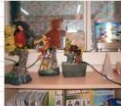
«Поющие и говорящие», «Журчащий фонтан», «Мигающие игрушки» Музыка для релаксации