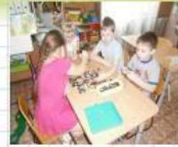
«Найди пару пуговице», «смотай клубочек»