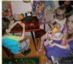
«Вылепи меня» «Кубик Рубик» «Жвачка для рук» «Лабиринты»