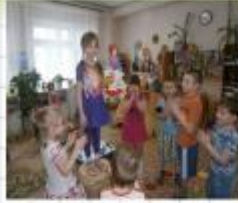
«Подиум» «Я сегодня самая,