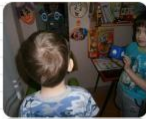
«Кубик эмоций», «Зеркало настроения»