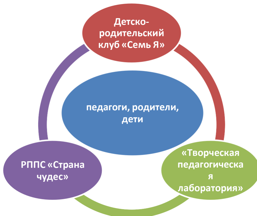
Рис.1. Схема взаимодействия со всеми участниками образовательного процесса

Новизна заключается в выработке новых стратегических подходов по взаимодействию семьи и ДООУ, для успешной интеграции детей в социум. Ценность программы состоит в наличии теоретического и практического материала, направленного на повышение педагогической культуры родителей и установление доверительных контактов между семьей и детским садом через внедрение нетрадиционных форм организации общения.