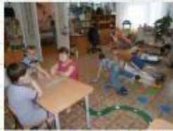
«Ганстер» и «Мини Ганстер»