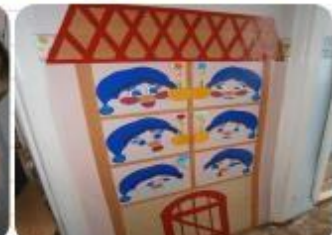
«Подари гномику свое настроение»