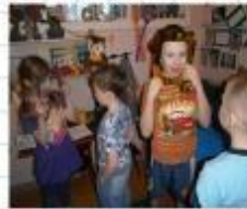
«Отражение в зеркале»