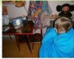
Пушистый плед, мягкие игрушки Аквариум ( проекционный светильник)